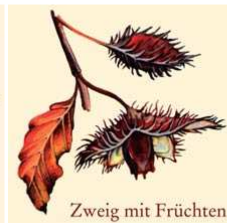
Zweig mit Früchten